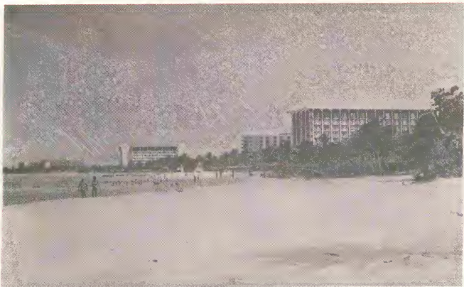
Turismo di Aruba ta sigui florece y 1981 tabata un anja cu atrobe a kibra tur record di bishitantenan den pasado. Pa fin di november 1981 a yega Aruba mas di 200 mil turista.